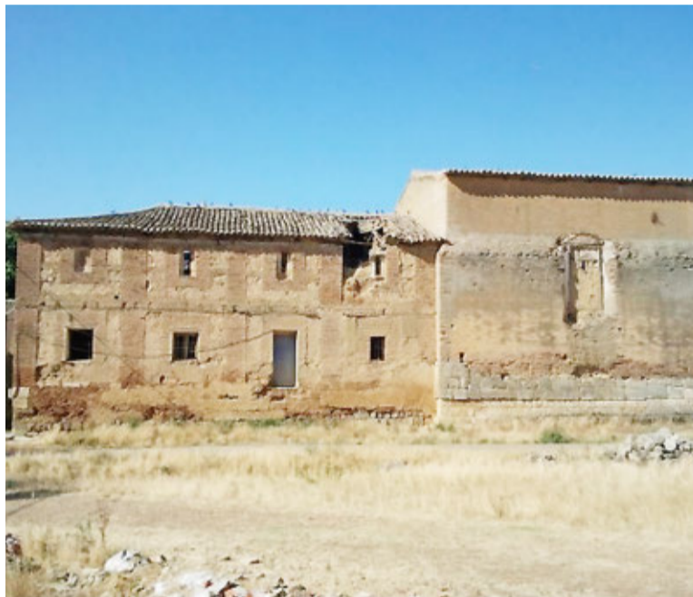
Estado actual del palacio de los Reinoso en la localidad de Autillo de Campos.

Este palacio es también conocido como el palacio de Berenguela, aunque en realidad pertenecía a su mayordomo, Gonzalo Ruiz Girón, señor de Frechilla, pues allí se refugió de los ataques del tutor real, Álvarez Núñez de Lara, la reina regente, Berenguela I de Castilla. Es aquí donde recibe la noticia de que su hermano, Enrique I, quien